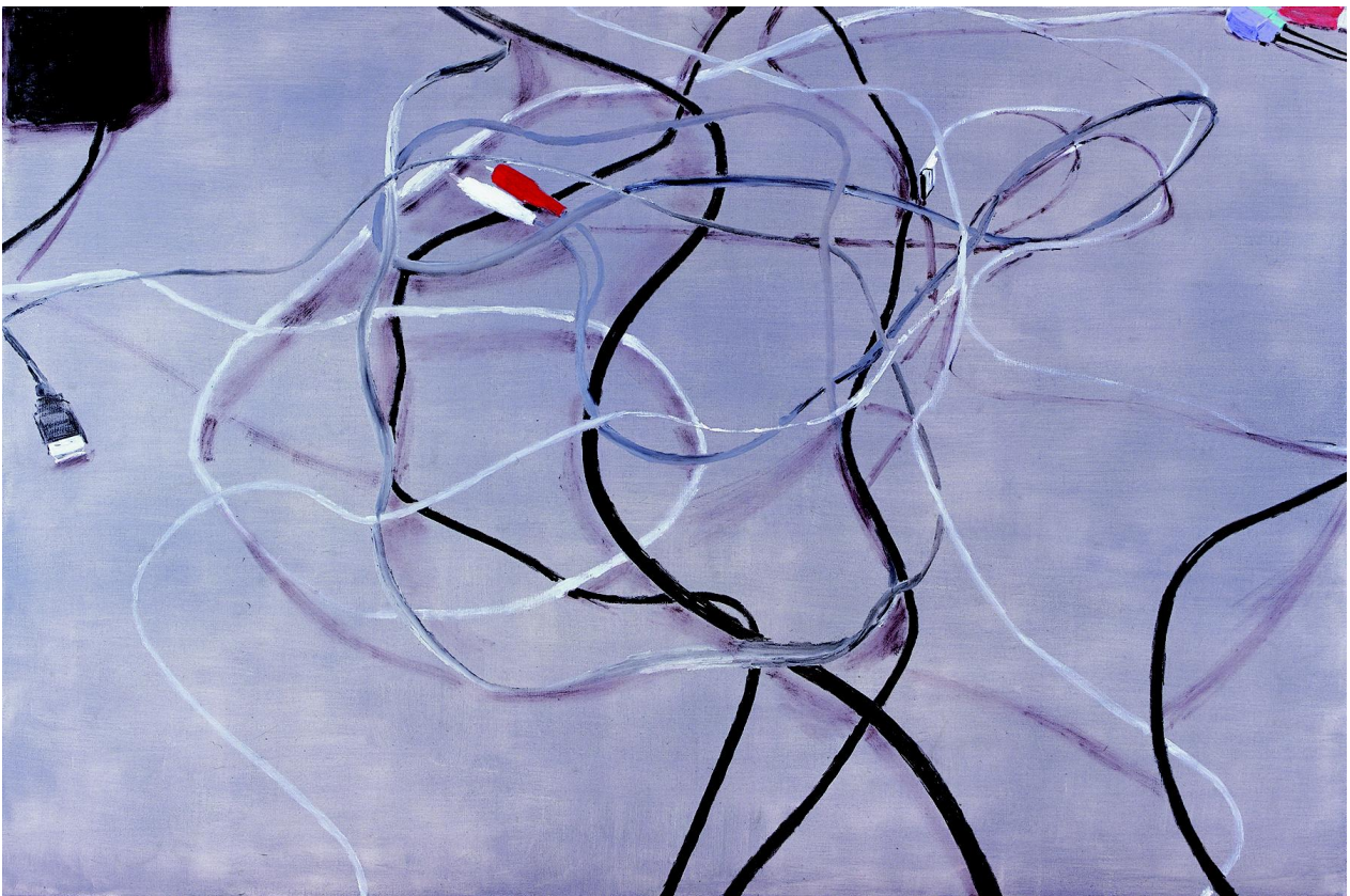
Miltos Manetas, Untitled (Cables) XIII, 2008, Oil on canvas, 288x190 cm, Courtesy The Artist and Valentina Bonomo gallery, Rome ↑download↓ (54 mb)